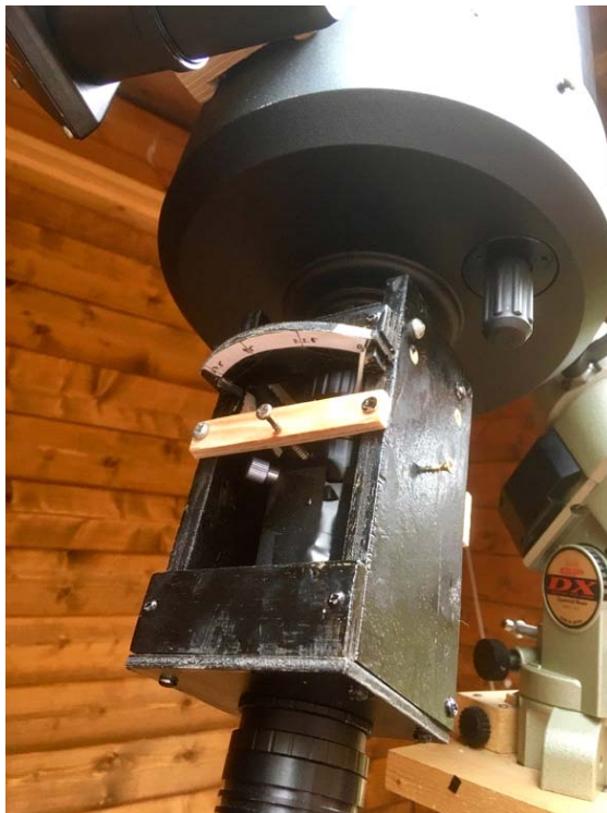
Abb. 2: Selbstbau Wollaston-Polarimeter mit drehbarer Verzögerungsplatte

Im Jahr 2014 diskutierte ich mit Ferdinando Patat von der ESO meine Polarisationsmessungen der Supernova SN 2014 in der Starburst-Galaxis M82. Er riet mir, ein neues Polarimeter mit einem Strahlteiler (Wollaston-Prisma) zu bauen, um die Messgenauigkeit der Polarisationsstärke deutlich zu verbessern. Beim Selbstbau des Polarimeters machte ich so ziemlich jeden Fehler, den man machen kann. Die Materialkosten betragen knapp 1000 €. Meine Erfahrungen stelle ich den BAV Mitgliedern gerne zur Verfügung.